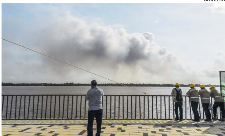
Imagen de la humareda que se observaba ayer desde el Malecón del Río.