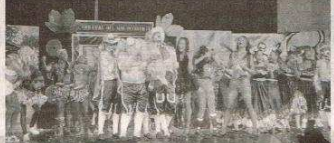
PARTE del show del lanzamiento del Carnaval del Suroccidente.

PROGRAMACIÓN El Carnaval del Suroccidente, informó que el 3 de febrero se realizará el Cumbión de la Virgen de la Candelaria en el barrio El Pueblo en la carrera 11 C con calle 117 esquina. El domingo habrá un Encuentro de Letanías en la Biblioteca de La Paz. El 3 de febrero será el gran desfile del Carnaval del Suroccidente saliendo de la calle 76 con carrera 26 A, el 12 de febrero desde las 4 p.m. será Carnaval Departamental Infantil en Villa Olímpica en Galapa y el 13 de febrero el desfile de Joselito se va con las Centizas en el Parque del barrio El Silencio.