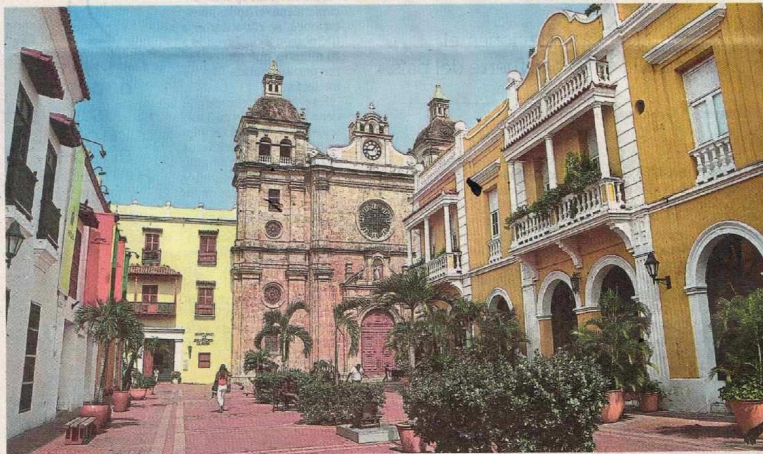
Expertos reunidos desde ayer dicen que hay que promocionar muchos lugares más, como se hace en Europa y Asia. CÉSAR ALANDETE/EL TIEMPO

JUAN CARLOS DÍAZ M. - EL TIEMPO @Jucad43