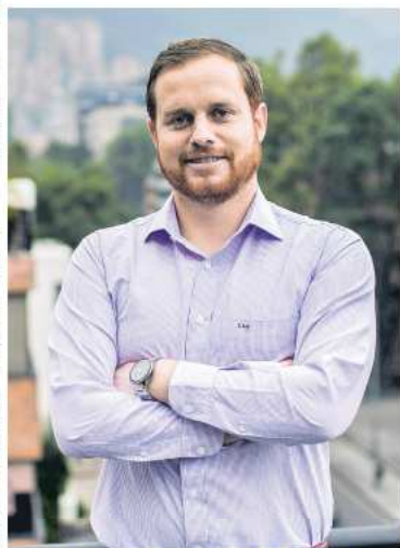
Según Sarasti (foto), compañías dedicadas a la innovación podrían ver a Colombia “poco interesante” para sus proyectos.

“El 90 por ciento de los taxistas no son dueños de los cupos, y les toca trabajar seis días a la semana, en turnos de más de doce horas para pagar la cuota de alquiler del vehículo. Nosotros podemos ayudar a cambiar eso, ya que en Cabify cada uno es dueño de su tiempo y su carro. Consideramos que somos una ayuda para el país, ya que estamos formalizando la economía”, concluyó.