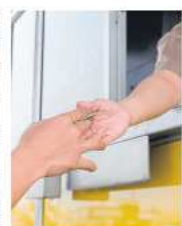
Recaudo en peajes, una de las líneas de negocio de Opesa.

Actualmente, Opesa posee el 77,5 por ciento de Recaudo de Valores (Reval), compañía que el año pasado registró ingresos operacionales por 27.357 millo-