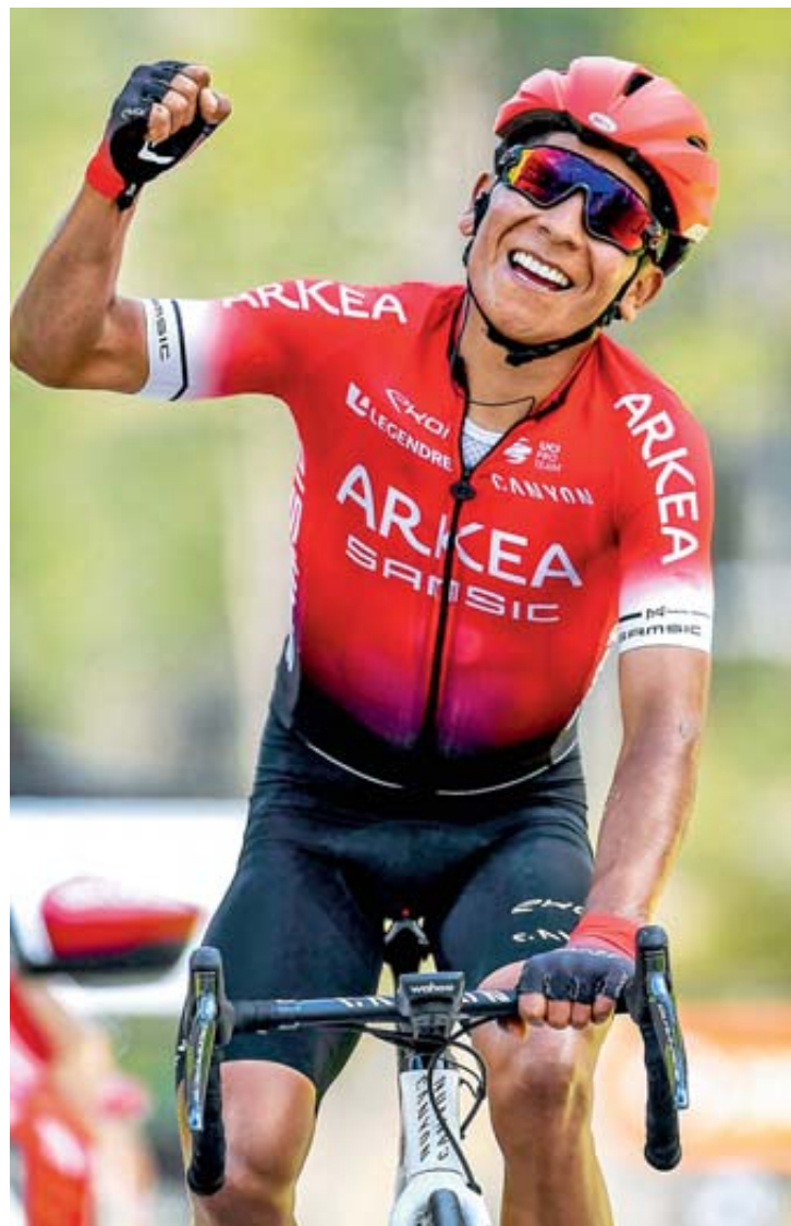
Este año, Nairo ha conseguido los títulos del Tour de la Provence y los Alpes Marítimos.

“Ganar con esa mentalidad del ‘yo puedo’, dejando a un lado las adversidades y hasta sin escuchar bien fue increíble. Me pasó lo de la ‘rana sorda’ que la pusieron a subir una torre y le decían cosas y logró llegar a la cima porque no escuchó ningún comentario negativo. A veces hay que ser así” ■